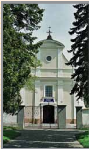
Kościół w Iłowie