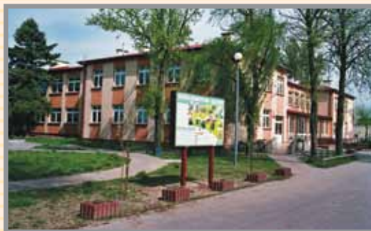
Budynek Gimnazjum w Iłowie

KONTAKT: URZĄD GMINY IŁÓW ul. Płocka 2, 96-520 Iłów tel.: (24) 267 50 80 fax: (24) 267 50 81 www.ilow.pl e-mail: ilow@ug.pl