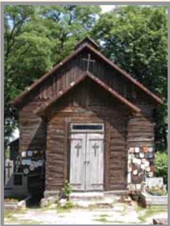
Kaplica na cmentarzu w Iłowie z XVII w.