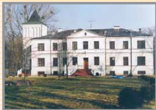
Pałac w Giżycach z XVII w.