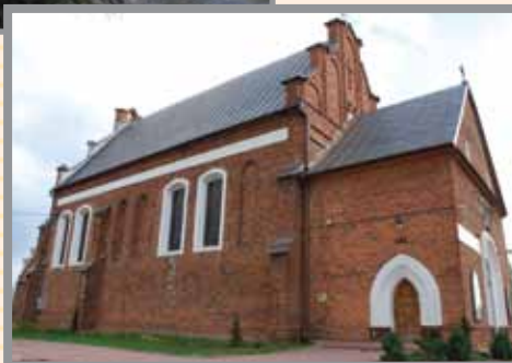
Kościół w Giżycach