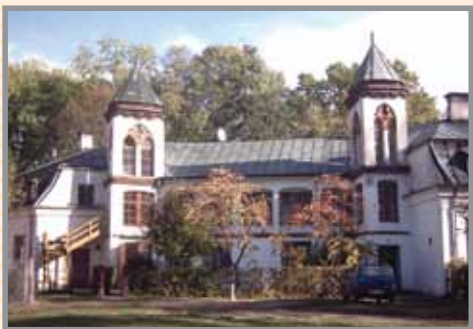
Pałac myśliwski w Zespole Pałacowo- Parkowym w Nowym Duninowie