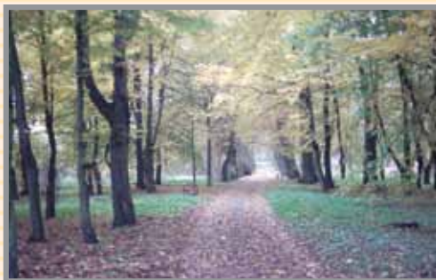
Park zabytkowy w Soczewce - aleja lipowa