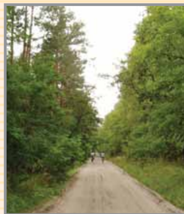
Lasy - naturalne bogactwo gminy