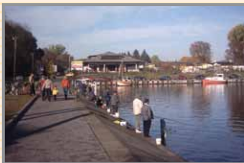
Port w Nowym Duninowie

Europejski Fundusz Rolny na rzecz Rozwoju Obszarów Wiejskich: Europa inwestująca w obszary wiejskie. Publikacja dofinansowana ze środków Unii Europejskiej w ramach osi 4 – LEADER Programu Rozwoju Obszarów Wiejskich na lata 2007 - 2013