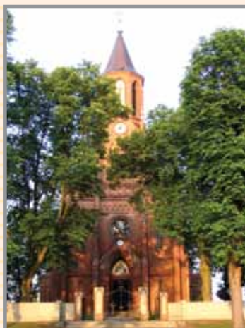
Kościół parafialny w Nowym Duninowie