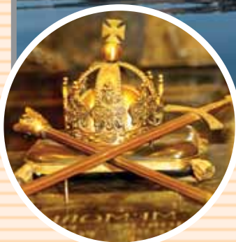
Sarkofag w Bazylice Katedralnej

z relikwiami architektury romańskiej i gotyckiej, a w gotyckiej wieży - obserwatorium astronomiczne, www.malachowianka.plock.org.pl