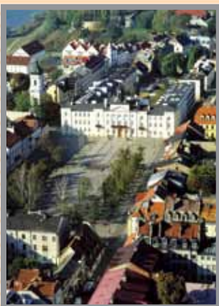
Stary Rynek i Ratusz

Biblioteka im. Zielińskich TNP - Pl Narutowicza - tel.: (24) 366 99 73, w której przebogatych zbiorach są m.in. „Kaprysy” Goi i pierwsze wydanie „De revolutionibus...” Mikołaja Kopernika.