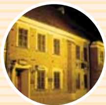
Budynek Towarzystwa Naukowego Płockiego