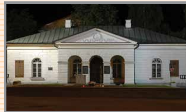
Przed Odwachem znajduje się Płyta Nieznanego Żołnierza

Odwach d. wartownia z 1837 r. , ul. Tumaska 4 , tel.: (24) 262 26 00 - siedziba PTTK .