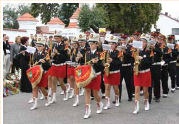
Orkiestra strażacka w Słupnie - brzmi i prezentuje się wdzięcznie

Gościnnie jest Ziemia Płocka dla swoich mieszkańców, turystów, przyrodników oraz potencjalnych inwestorów krajowych i zagranicznych.