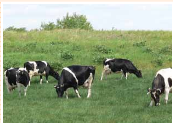
Muuuuuusimy mieć najlepszą łąkę, żeby wyrosnąć na tak dorodne sztuki

Z naszej inicjatywy zrealizowaliśmy już dwie doroczne edycje Konkursu dla Przedsiębiorców Powiatu Płockiego „O Kryształowy Kokos Roku” Starosty Płockiego.