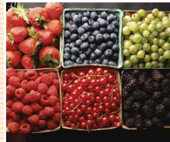
Dary sadów, plantacji i lasów Ziemi Płockiej - do wyboru, do koloru

Stado Ogierów w Łącku zaprasza na wczasy w siodle oraz na zawody jeździeckie i pokazy woltyżerki o międzynarodowej randze. Warto zwiedzić piękny, zabytkowy obiekt stadniny, gdzie hodowane są szlachetnej rasy konie. Do wypoczynku zachęcają hotele i ośrodki wypoczynkowe wokół jezior i wśród lasów zasobnych w grzyby, jagody i borówki, a także w zwierzynę łowną.