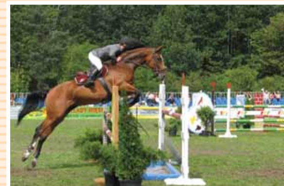
Miłośników końskich grzbietów zaprasza Stado Ogierów w Łącku

Czternaście rezerwatów przyrody i kompleksy leśne w Gostynińsko - Włocławskim oraz Brudzeńskim Parku Krajobrazowym - to pozostałości puszczy i kniei porastających kraj w przeszłości sięgającej XI wieku. Naturalnie płynące rzeki wiją się meandrami, a liczne jeziora tworzą doskonałe warunki dla miłośników żagli i sportów wodnych.