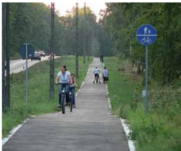
Coraz więcej wycieczek rowerowych służy poprawie kondycji, zdrowia i bezpieczeństwa mieszkańców powiatu

Powiat znacznie inwestuje w infrastrukturę drogową i budowę chodników. Wspiera również inicjatywy na rzecz bezpieczeństwa drogowego, w tym budowę ścieżek rowerowych, szczególnie na trasach atrakcyjnych turystycznie. A takich terenów u nas nie brakuje.