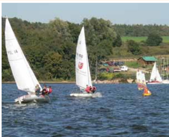
Regaty na Wiśle

Z entuzjazmem włączyliśmy się w inicjatywę „Zielony Szlak Rowerowy Mazowsza”. Przystąpiliśmy również do Mazowieckiej Regionalnej Organizacji Turystycznej patronowanej przez Marszałka Województwa Mazowieckiego, wszystko po to, aby pobudzić aktywność w zakresie rozwoju turystyki na Mazowszu, a przede wszystkim w naszym powiecie. Członkostwo powiatu w Stowarzyszeniu Gmin Turystycznych Pojezierza Gostynińskiego dobrze służy działaniom na rzecz tworzenia korzystnego klimatu dla rozwoju turystyki. Powiat płocki dysponuje świetną bazą szkolną