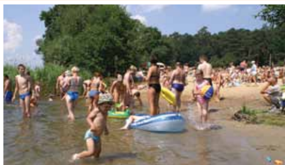
Wypoczynek nad jeziorem Górskim w Łącku – czysta woda, łatwy dojazd i mnóstwo słońca

Smakoszom oferujemy staropolskie zdrowe i sielskie jadło w gospodarstwach agroturystycznych, smaczne mięsowa i ryby komponowane w zestawach ziół i przypraw z mazowieckich łąk.