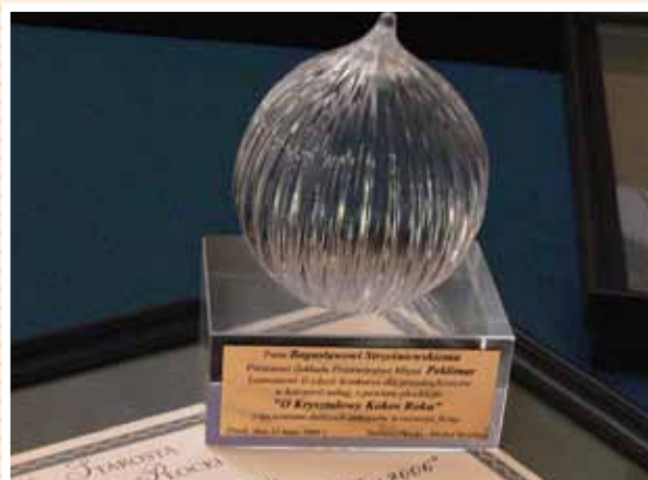
Statuetka dla Firmy Roku przyznawana w dorocznym konkursie dla Przedsiębiorców „O Kryształowy Kokos Roku” Starosty Płockiego